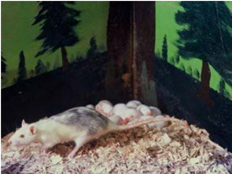
Billeder af rottelivet i 'Rat Park'.