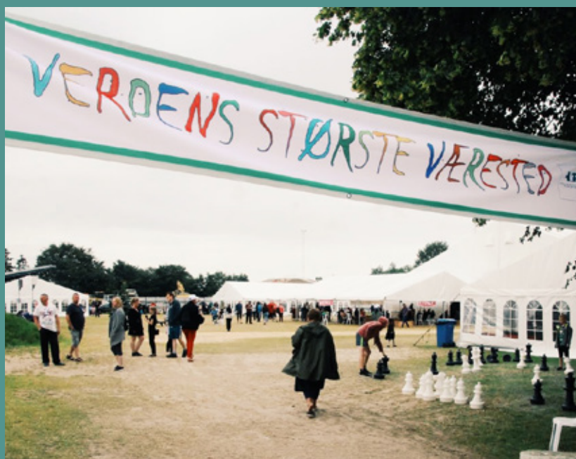
1700 mænd, kvinder og børn deltog i dette års camp, hvor der dagligt var et væld af aktiviteter.

En andet del af rusmiddelpolitikken er, at det ikke er tilladt