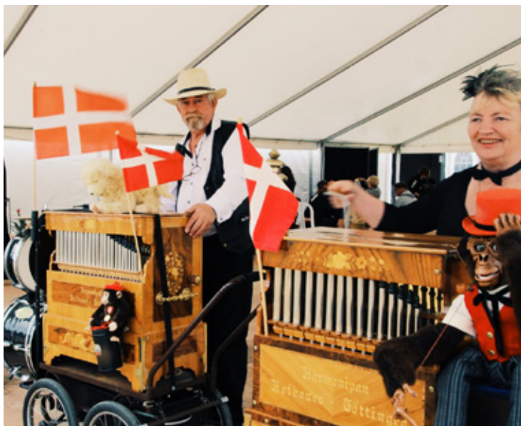
Underholdningen var mangfoldig. Lirekassemænd og -dame sørgede for godt humør.

det gør de ikke længere. Campen har også sørget for, at der er et afsides sted, hvor deltagerne kan tage deres stof og drikke deres øl, eller hvad de har behov for.