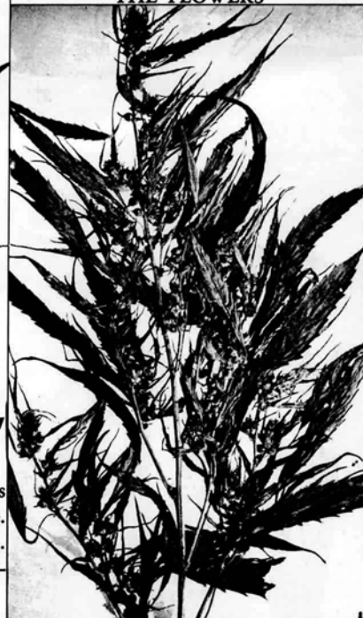
When mature, are irregular clusters of seeds light yellow-greenish in color.

IT IS A CRIME for any person to plant, cultivate, possess, sell or give away Marihuana.