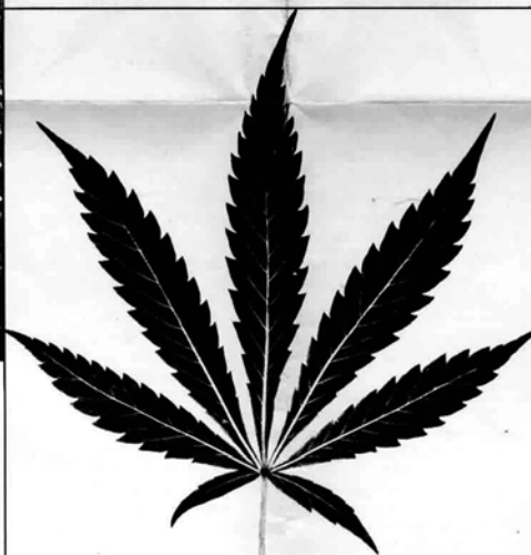
UNDER SURFACE OF MARIHUANA LEAF.

Compound, composed of five, seven, nine or eleven—always an odd number—of lobes or leaflets, the two outer ones very small compared with the others. Each lobe from two to six inches long, pointed about equally at both ends, with saw-like edges; and ridges, very pronounced on the lower side, running from the center diagonally to the edges. Of deep green color on the upper side and of a lighter green on the lower. It is the leaves and flowering tops that contain the dangerous drug. These are dried and used in cigarettes and may also produce their violent effects by being soaked in drinks.