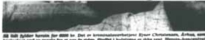
88 milliarder kroner for 2000 år. Det er kronenomsættelsen i byen Christianshavn, København, som bestyret ved en tælle for et par år siden. Sluttet i lyset er ikke, rest: Hver-års-koncentrat

Narkotikarådets Stof nr. 11, 2000: Metadon er bedre end sit rygte. Af Karen Ellen Spannow