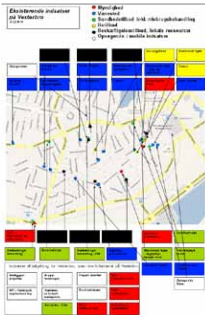
Se kortet i fuld størrelse på www.stofbladet.dk

mært mennesker med alkoholproblemer. Senere kom stofferne, og fra ca. 1990 som et udslag af politiets stresspolitik samlede mange stofmisbrugere på Maria Kirkeplads og søgte ly i kirken og hos Mariatjenersten. De første gadesygeplejersker arbejdede med base i Maria Kirke og frem til 2009 var Maria Kirkeplads det centrale samlingssted for den 'åbne narkoscene'.