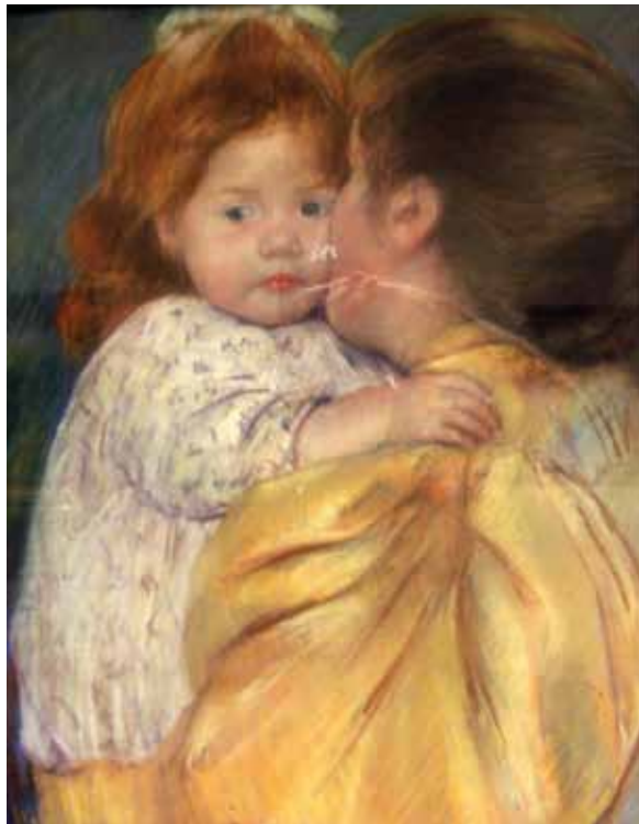
Finnegan: 'Vi lærer af vores mødre. På maleriet af Modigliani hænger baby som en tøjdukke. Hos Cassats er der øjenkontakt. Hvis din mor ikke knyttede sig til dig, knytter du dig ikke til din baby. Vi må undervise mødre i tilknytning'. www.sitemaker.umich.edu/substance.abuse.history/oral_history_interviews

stofhandel være deres dagligdag. Mange har en kaotisk livsstil, lav frustrations-tolerance og manglende evne til at udsætte umiddelbar behovstilfredsstillelse (gratifikation). Nogle af dem dør med psykiatriske sygdomme, så de har på en måde allerede taget skade, og stofferne hjælper dem med at klare sig.