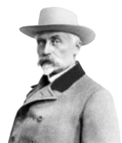
VIGGO HØRUP (1841-1902) STIFTER AF POLITIKEN I 1884

2 læserbreve og debatindlæg handlede om OK 18