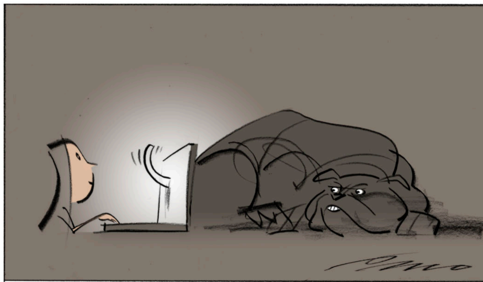
Arkivtegnning: Per Marquard Otzen

Men hvorfor er vi så irrationelle? Hvorfor bliver vi hængende, når det nu er bevist, at mediet læser dig for private data? Hvorfor accepterer vi, at vores breve i