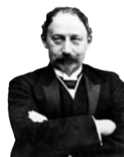
EDVARD BRANDES (1847-1931) STIFTER AF POLITIKEN I 1884